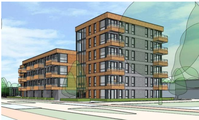
Eerste impressie van de Wilgenflat

We verwachten begin 2023 te beginnen met bouwen. Het bouwen van de hele flat duurt ongeveer een jaar. De planning is dat de appartementen eind 2023 of begin 2024 bewoond kunnen worden.